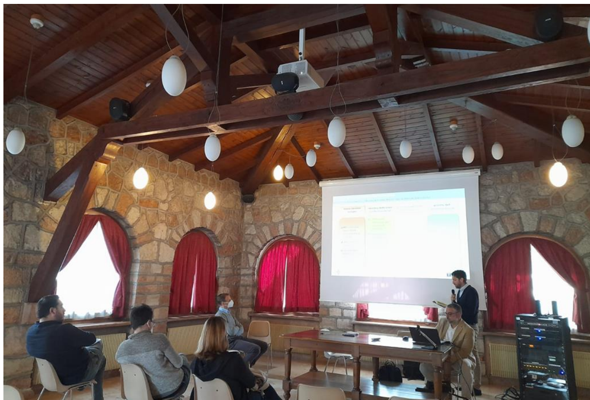
Figura 3 - La condivisione degli esiti delle indagini e dell'avvio della partecipazione con le Amministrazioni e i referenti