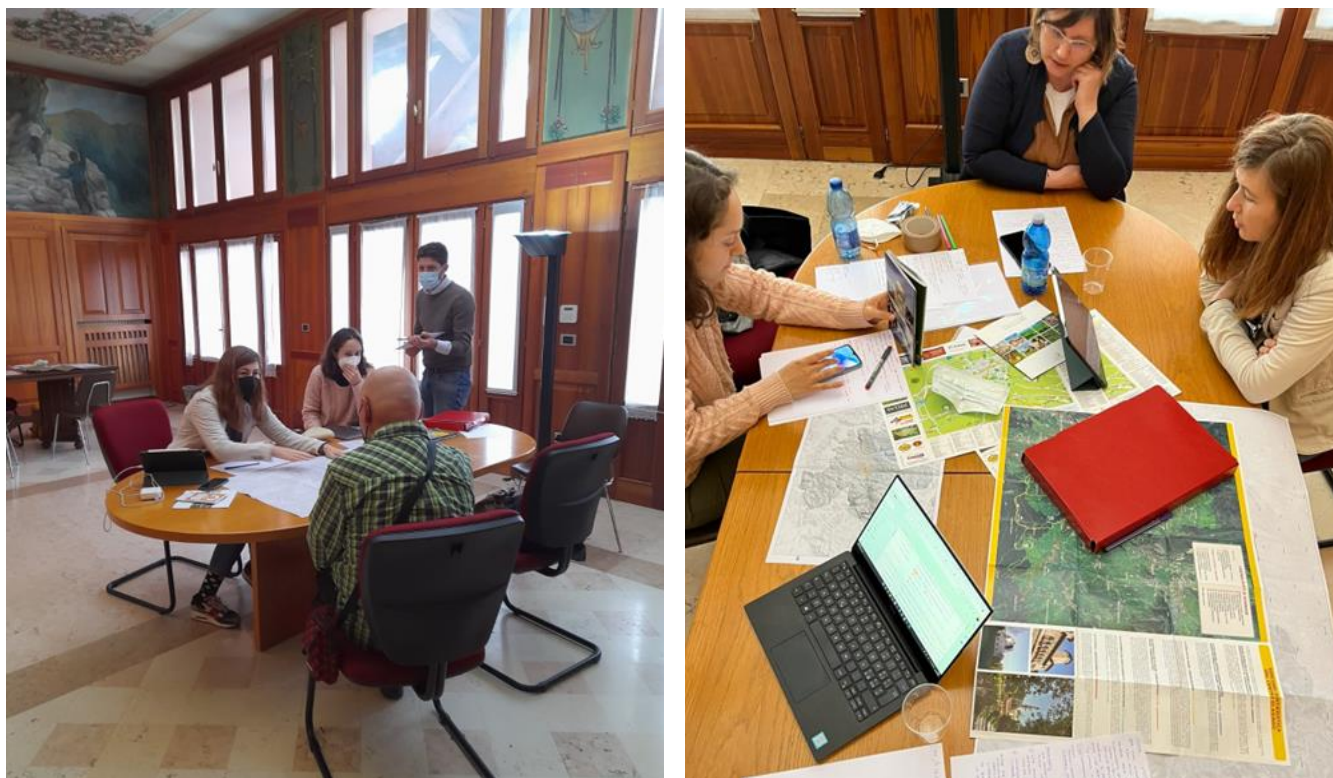
Figura 1 - Fase 4: Incontri in loco e realizzazione delle interviste