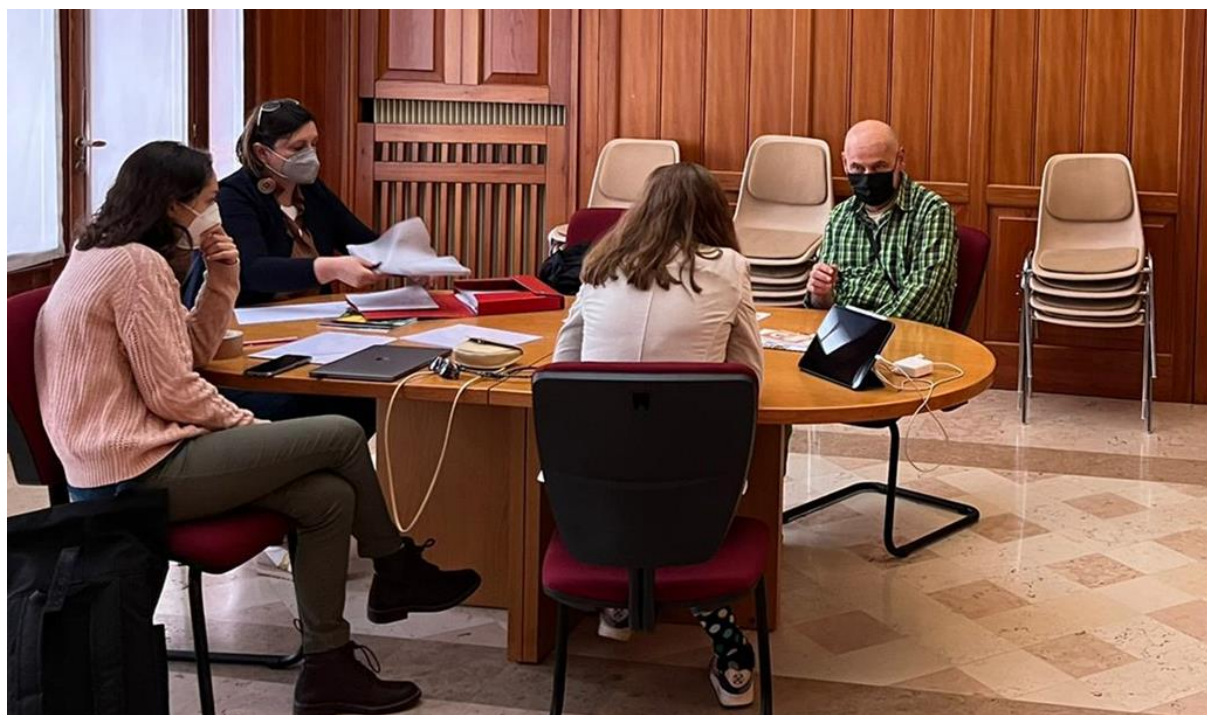
Figura 4 - Fase 4: Incontri in loco e realizzazione delle interviste